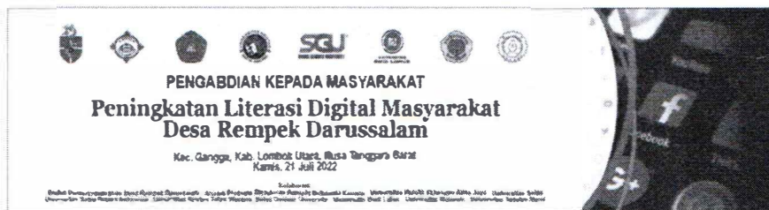
Gambar 2 Desain spanduk Abdimas di Desa Rempek Darussalam.

Berangkat dari pemikiran bersama akademisi Ilmu Komunikasi dari ragam institusi maka peningkatan literasi digital bagi masyarakat Desa Rempek Darussalam (hasil pemekaran daerah Desa Rempek) dipandang perlu. Adapun kolaborasi yang terjadi melibatkan delapan (8) institusi, berurutan dari kiri ke kanan pada Gambar 2: Universitas Katolik Indonesia Atma Jaya, Universitas Sahid (USAHID), Universitas Satya Negara Indonesia (USNI), Universitas Kristen Satya Wacana, Swiss German