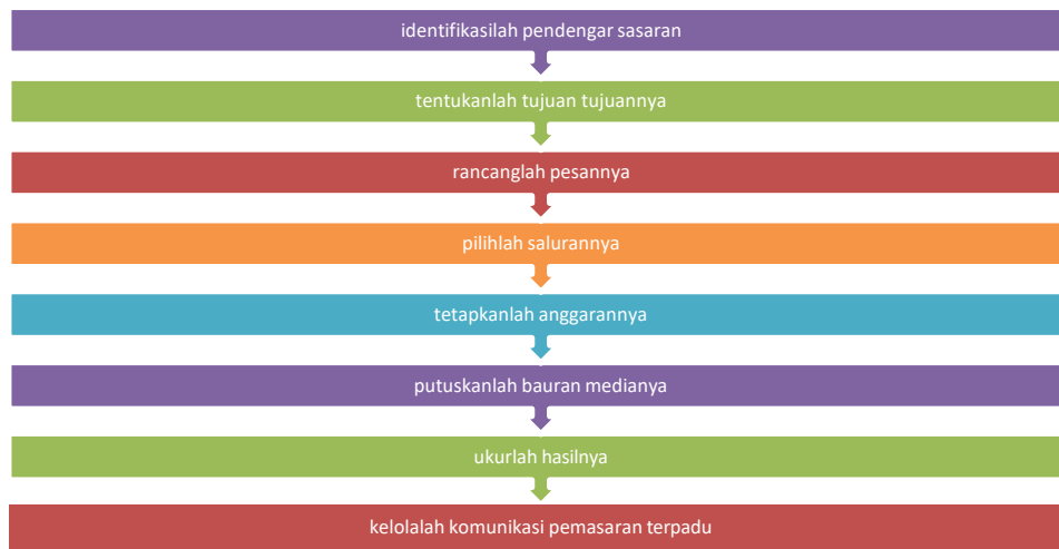
Gambar : Tahap Tahap Mengembangkan Komunikasi Efektif