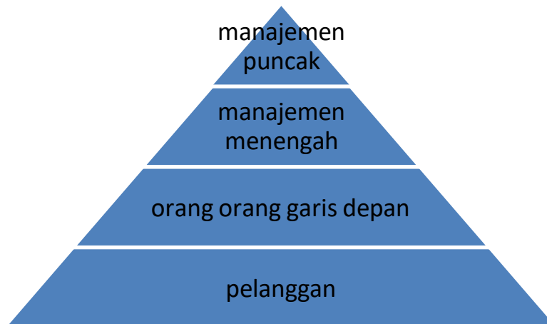
Diagram : organisasi tradisional